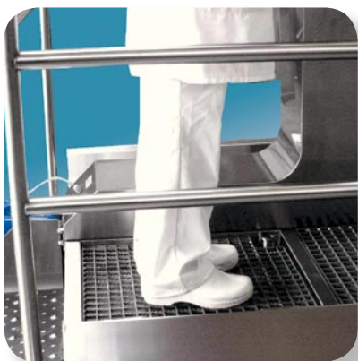
optional: Sohlendesinfektion mit anschließender Abtropfzone