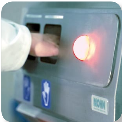
Handdesinfektion mit überlistungs-sicheren Sensoren