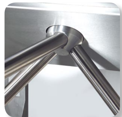
Drehkreuz komplett aus massivem Edelstahl